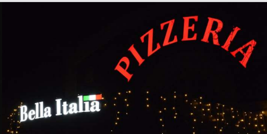
Znaki z plexi na elewacji.